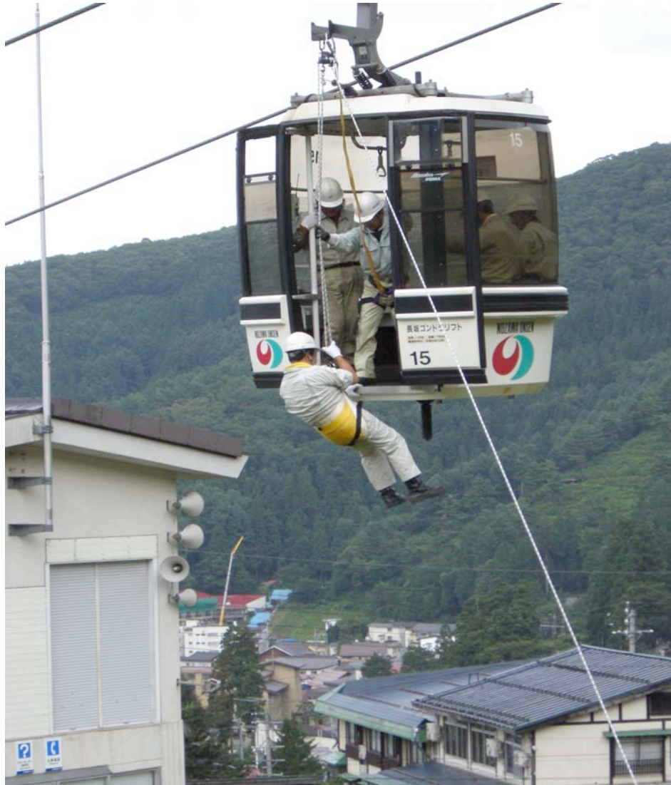
野沢温泉スキー場

長坂ゴンドラリフト、日影ゴンドラリフト、パラダイスフォーリフト、上ノ平フォーリフト、やまびこフォーリフト、やまびこ第2フォーリフト、チャレンジペアリフト、柄沢ペアリフト、日影トリプルリフト、長坂トリプルリフト、水無トリプルリフト、日影第2ペアリフトA線、日影第2ペアリフトB線、ユートピアペアリフト、カンダハーペアリフト、真湯ペアリフト、湯の峰ペアリフト、スカイライン連絡ペアリフト、長坂フォーリフト、長坂ゴンドラ連絡ペアリフト